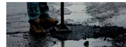
Hull & maskinkutt på veier og plasser