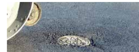
Kummer, vannarmatur & avløp