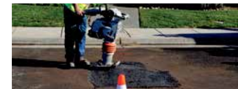
Sprekker, dekke & kantreparasjoner